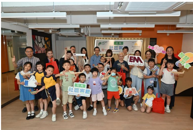
義工及一眾參加者合照。